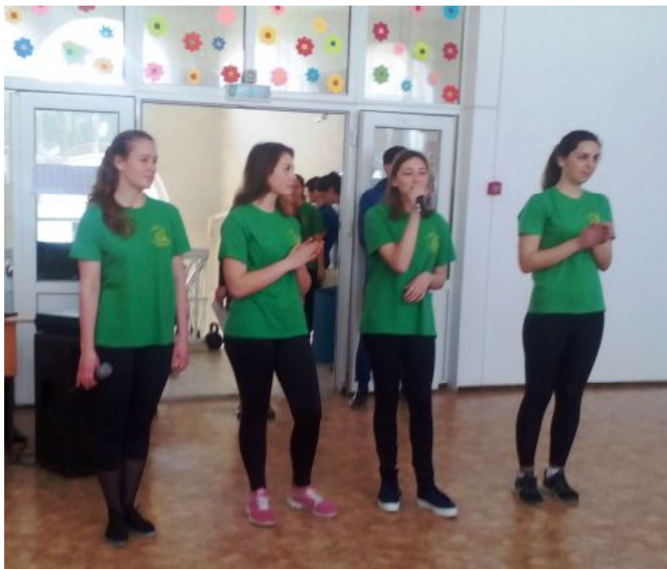
Выступление школьной агитбригады «Важней всего подружиться с ГТО!»