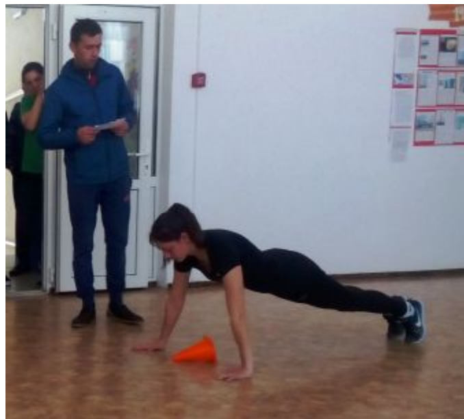
Демонстрация выполнения нормативов испытаний ГТО (поднимание туловища из положения лежа на спине, сгибание и разгибание рук в упоре лежа на полу)