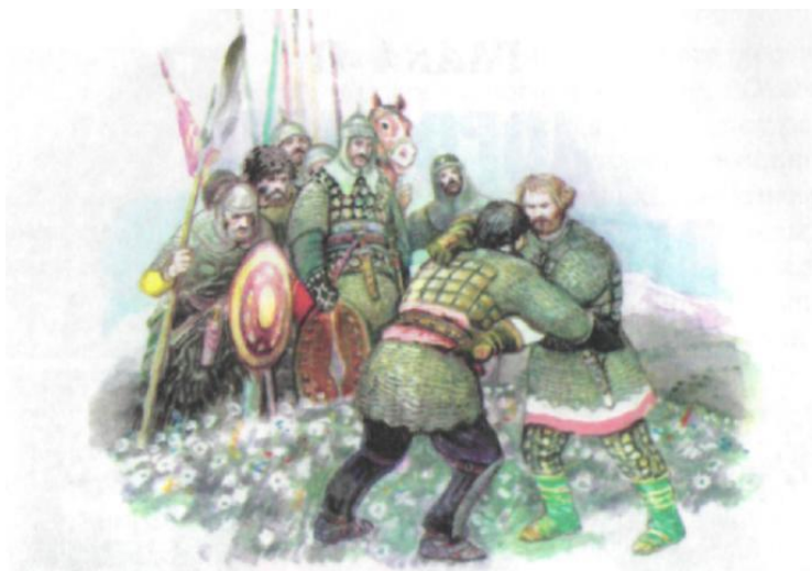
Поединок Святослава с Рередей

5 задание : предлагаются картинки с сюжетом истории Кубани. Нужно рассказать, о чем говорится в данном сюжете